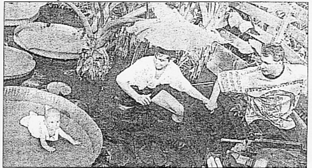
Dans la mare aux crocodiles, on y trouve des photographes en caleçon, et image plus surréaliste, des bébés...

La Ferme aux Crocos, je vous l'ai bien dit, c'est le paradis des photographes!