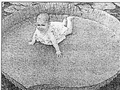
Ceci n'est pas une grenouille contrairement à ce que vous pourriez croire.