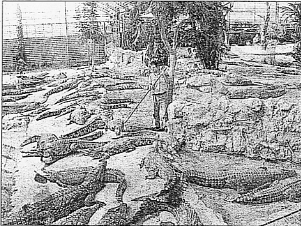
Cet été, on nous promet des plages très encombrées. Faites comme Luc Fougeirol, allez-y pelle en main!

D'ailleurs, toutes les plantes ici, toutes les fleurs, sont plus étonnantes les unes que les autres. Étonnantes par leurs formes, leur taille, leur couleur. Des cascades de fleurs qui semblent